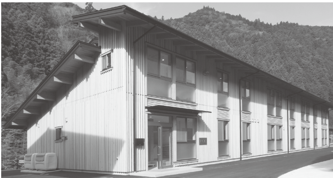
完成した梼原町生涯学習交流センター2号棟