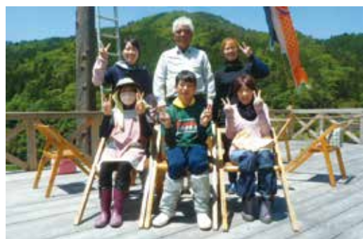
岡田農園では多くの女性が働いている