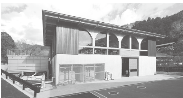
森林資源を活用し地域経済に還元するよう取り組む 木質バイオマス発電所が太郎川公園内に完成

また、木材を搬出しなければならず、森林の広域的機能を発揮するためには、搬出しやすく整備するための支援が必要であると考えており、しっかりと取り組んでいきたい。