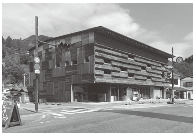
今回の修繕費には茅葺き部分は含まれていない

ない。町としても、茅葺きは通常の外壁より維持管理コストがかかるため、今後の管理方法を検討していく。