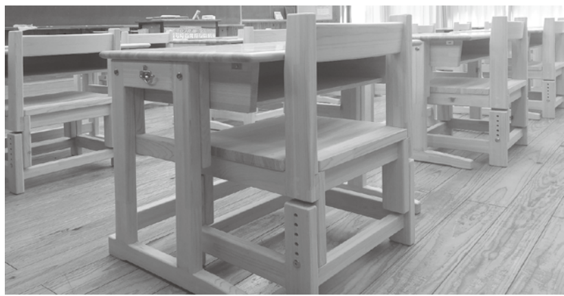
梶原学園入学生に毎年購入している椅子・机