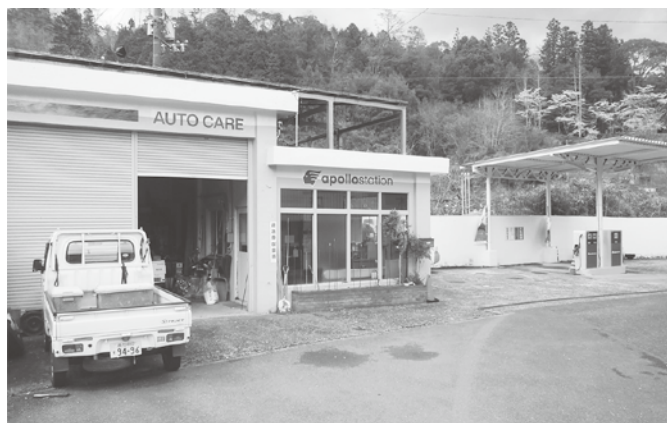
集落活動センターが運営する松原給油所

ご指摘のとおりで、現在高知県に補助金があることは調べているが、今後必要となった際には町の持ち出しが少なくなるようにしていく。