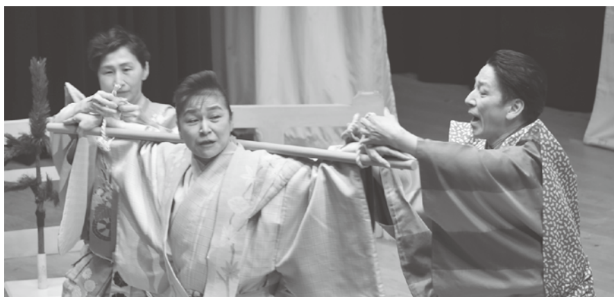
芸術祭補助金を活用して実施した和泉流宗家による狂言公演

狂言公演については、これまで無料開催であったことや、参加状況が読めなかったことから、入場料は徴収しなかったが、今後は内容に応じて参加費のあり方も検討していく。